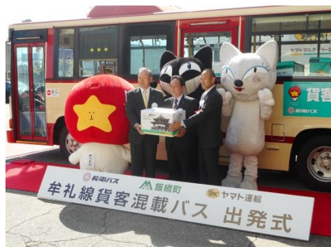
2017年10月1日に行われた出発式