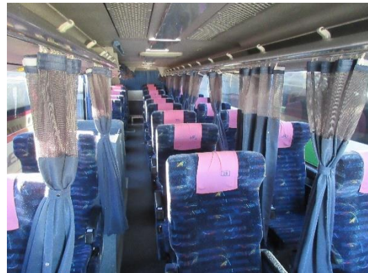
3列シートの車内イメージ