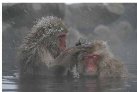
&lt;スノーモンキーパーク&gt;