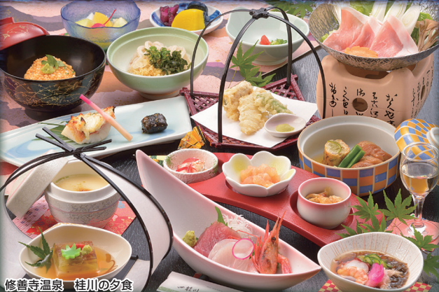
修善寺温泉 桂川の夕食