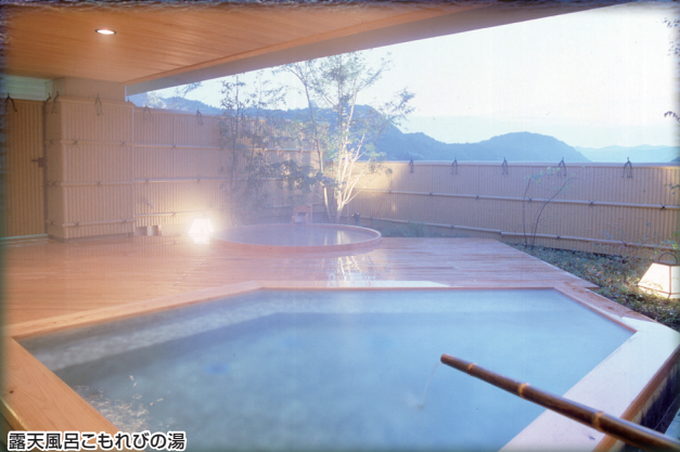
露天風呂ごもればの湯